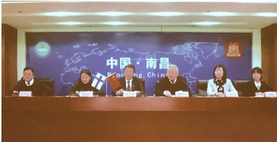
Nanchangin kauppakamarin kanssa järjestettiin videotapaaminen, kun Korona pandemia esti matkustuksen Kiinasta.